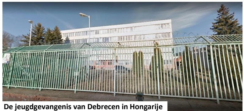
De jeugdgevangenis van Debrecen in Hongarije