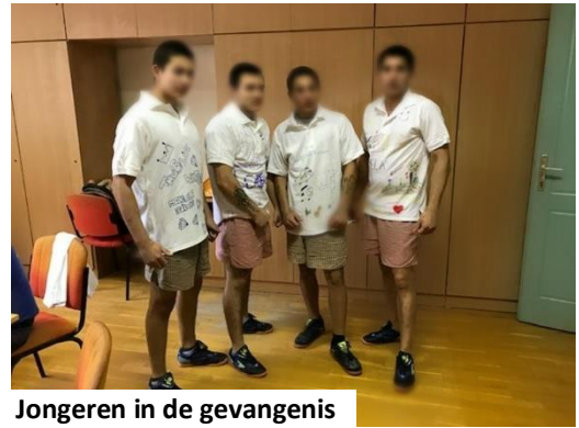
Jongeren in de gevangenis