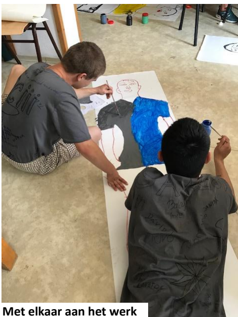
Met elkaar aan het werk