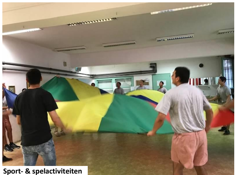
Sport- & spelactiviteiten